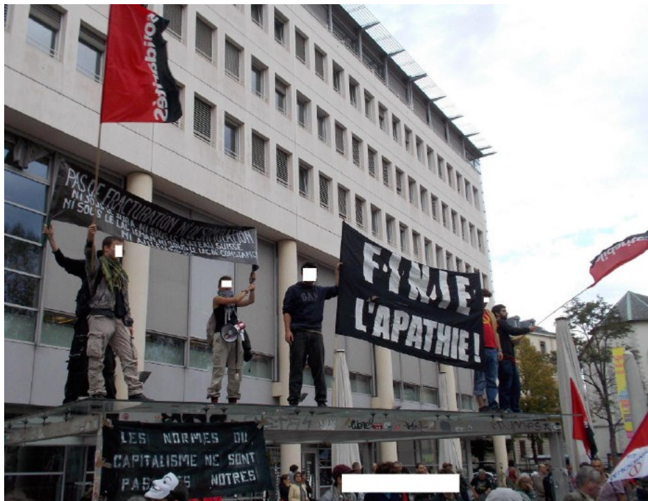
Genève Université 11 Octobre 2014

www.abolition2000.org http://www.nonaumissilem51.org/ http://acdn.france.free.fr