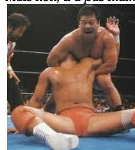
...C'est de l'ostéo, chef !