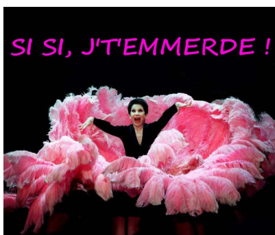
Son truc ? Voler dans les plumes...

En public, lors des réunions de service , en face à face, rien n'arrête Iznogoud dans sa soif de « tuteurer » le nouveau; pour son bien, il l'oblige ainsi à partir tous les soir à 19H , quand tout le monde est parti... Sans doute pour qu'il puisse travailler au calme et sereinement ???