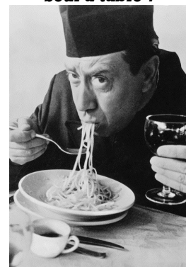
Le calice jusqu'à la lie...