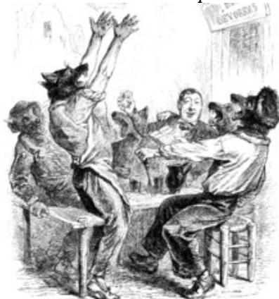
Et faire déguster en meute...