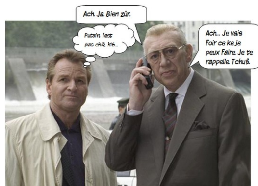
Questions balèzes pour traîner dans la glaise ?