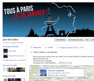
La page de l'événement de « Jour de colère ».

À l'origine de cet événement se trouve un site Internet vide de tout contenu qui décrète à l'automne 2013, le 26 janvier « Jour de colère ». Depuis, le site s'est étoffé, avec une liste d' une cinquantaine de soutiens et un manifeste qui réclame « la "coagulation" de toutes les colères ». « Jusqu'ici, le gouvernement table sur la segmentation des contestations pour mieux les isoler et les mépriser. Il est temps d'unir nos forces autour des points communs qui nous rassemblent », explique le texte.