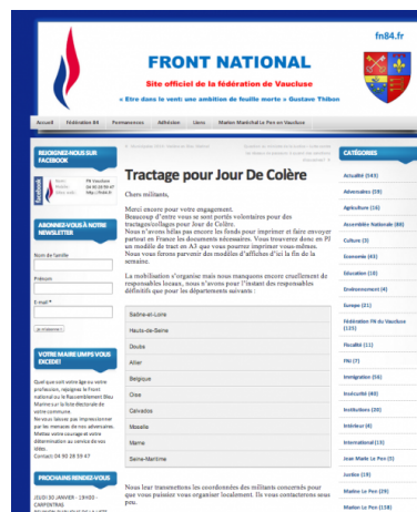
Billet du 18 décembre 2013 sur le site du FN du Vaucluse.

D'autres font carrément marche arrière. Le collaborateur de Marion Maréchal Le Pen, qui avait d'abord indiqué à Mediapart que la députée FN serait probablement présente à la manifestation, nous a expliqué en milieu de semaine qu'elle ne s'y rendrait pas à cause de « l'environnement, l'appel des pro-Dieudonné, la crispation des échanges sur le web ». Pourtant, en décembre, sa fédération du Vaucluse participait à l'organisation de la manifestation. Depuis, ce billet a disparu .